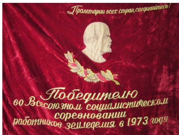
Переходящее Красное Знамя колхоза «Победа»