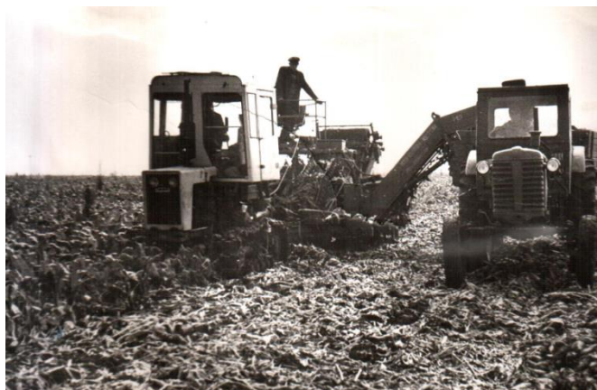
На тракторе Лауреат премии Ленинского комсомола тракторист Мигранов Рифкат на уборке сахарной свеклы