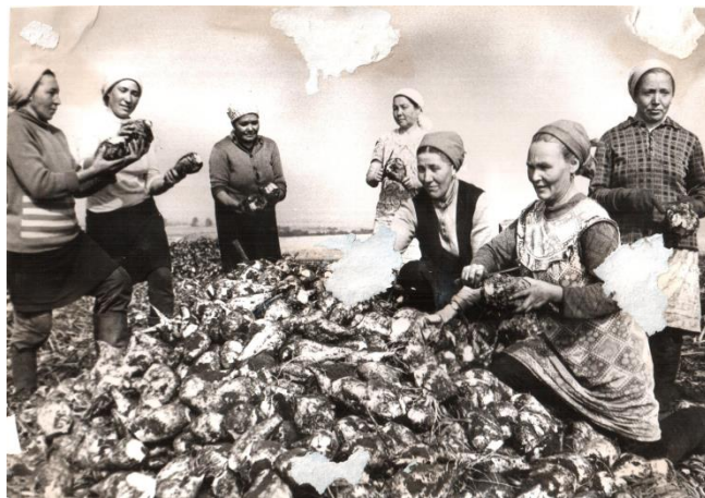
На свекловичном поле