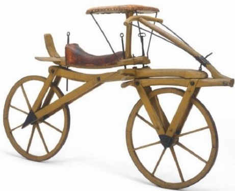
Выглядел первый велосипед приблизительно так

Само слово «Велосипед», появилось в 1860 году, во Франции, Пьер Мишо хотел подобрать такое слово, чтобы оно определило транспортное средство на двух колесах с простым механическим приводом. На французском слово звучит – VICYCLETTE (Би Секлетте) .